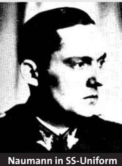
Naumann in SS-Uniform

Schlussstrich und Generalamnestie dienten keinesfalls allein der Wiedereingliederung belasteter Nazis in das private Leben, sie waren Voraussetzung für weitere verschwörerische Tätigkeiten gegen die Demokratie. Bereits sechs Jahre nach dem Krieg trafen sich etliche Nazis um Goebbels Staatssekretär Werner Naumann (Naumann-Kreis) zu einem Geheimtreffen mit dem Ziel der Bildung einer neuen Naziartei. Auch Ernst Achenbach gehörte dazu. Da auch Ministerialbeamte an der Sitzung teilnahmen, kann man davon ausgehen, dass das Treffen mit Wissen der Bundesregierung stattfand.